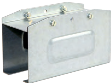
Соединительный элемент КТ