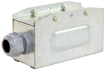
Питающий элемент КТ