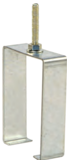
Скользящая подвеска КТ