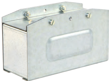
Торцевая крышка КТ