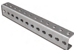
Подвесная скоба ТВ